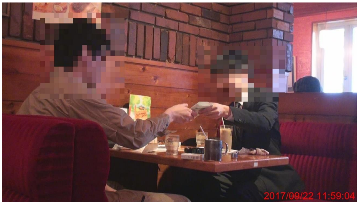
封筒の受け渡しを行う男性 A と㊟①