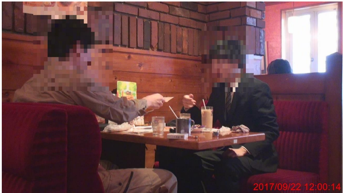
領収書を手渡す男性 A

12:13：㊦と男性 A が同店舗内から出て来て、同店舗の前で別れた後、それぞれ移動を開始する姿を現認した。