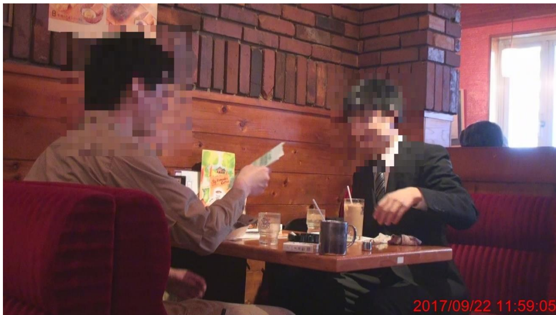
封筒の受け渡しを行う男性 A と㊟②