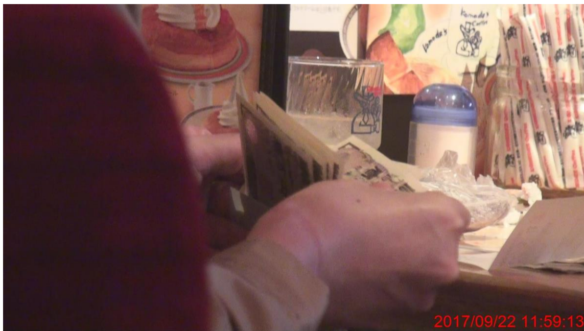
封筒の中の現金を確認する男性 A